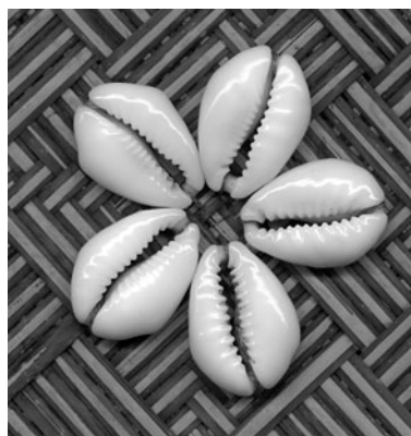
Kaurimuscheln: vermutlich das erste Zahlungsmittel der Menschheit.

Die holprigen Straßen in der DDR. Die schlecht gefederten Omnibusse. Im Kapitalismus ist alles besser geteert und gefedert.